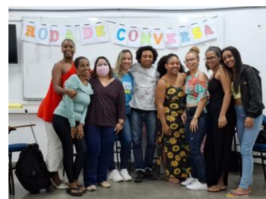
Fig. Roda de Conversa com Representante da Comissão de Moradores dos Barris (CMB) (II Roda de Conversa com a Turma)

Das duas rodas de conversa, emergiram pontos analíticos prioritários, identificados por nós como pesquisadores, para repensar as ações extensionistas, com o objetivo de promover uma extensão mais dialógica, na qual discentes, docentes, técnicos-administrativos e a população sejam todos atores e atrizes ativos. Um dos principais objetivos dessa interação deve ser, sem dúvida, promover o desenvolvimento e a construção de uma sociedade mais humana, justa e feliz.