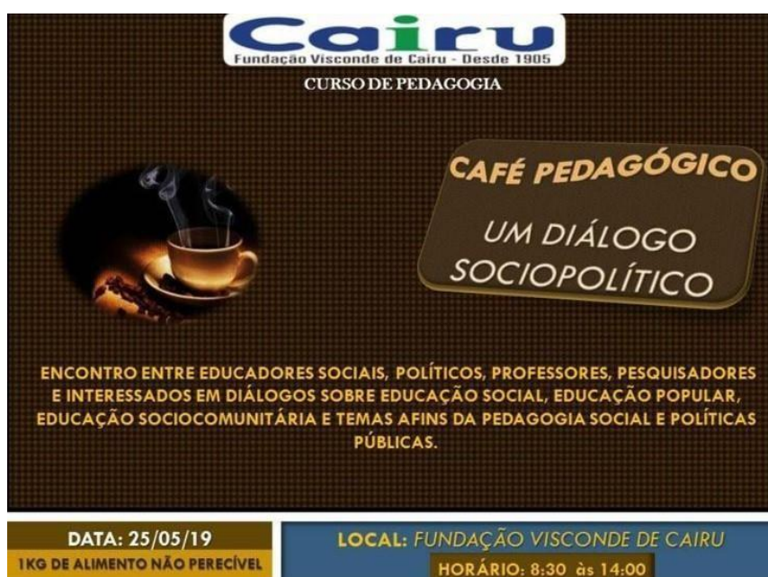
Figura do Arquivo do Projeto: Café Pedagógico: um diálogo sociopolítico

Realizado anualmente, o evento envolve os estudantes em todas as etapas de organização, desde a criação da logomarca e produção de materiais de divulgação até o contato com líderes comunitários, artistas e políticos que promovem ações sociopolíticas.