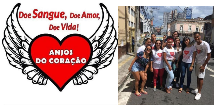
Figuras do Arquivo do Projeto: Anjos do Coração - Campanha Doação de Sangue Realizada em 2017.