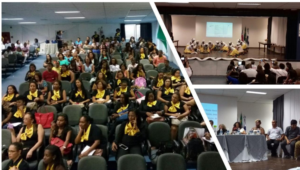
Figuras do Arquivo do Projeto: Café Pedagógico: um diálogo sociopolítico, realizado em 2017

A ação é aberta às comunidades, promovendo o desenvolvimento de conhecimentos técnicos, científicos e culturais que visam a melhoria da qualidade de vida e o benefício coletivo, através da interação transformadora entre a instituição e outros setores da sociedade. Após o Café Pedagógico, os/as estudantes avaliam qualitativamente seu percurso de aprendizagem ao longo do semestre letivo, refletindo sobre o impacto e as lições aprendidas.