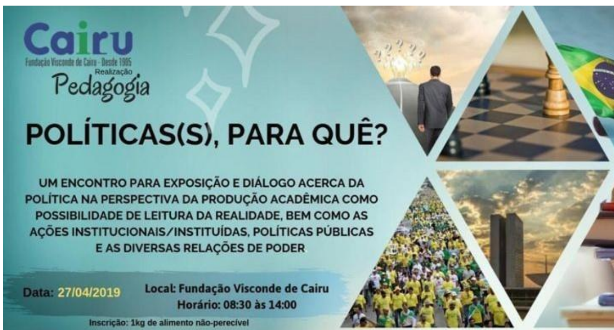
Figura do Arquivo do Projeto: Políticas, Para Que? — imagens dos cards de divulgação do evento realizado em 2019