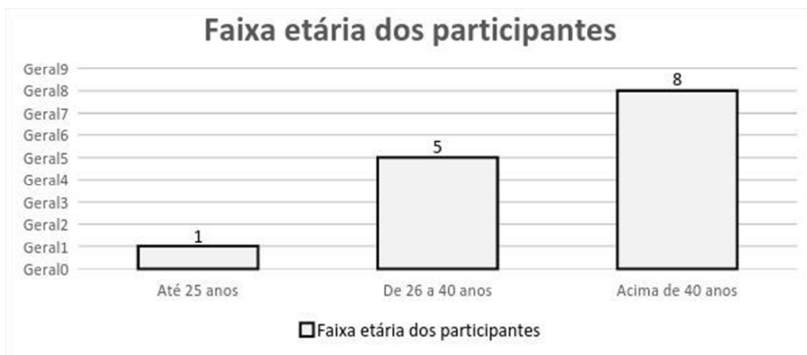
Gráfico 1 - Faixa etária dos participantes da pesquisa

As duas primeiras perguntas se configuram como próprias de uma única seção pois buscam traçar um perfil dos participantes classificando-os por faixa etária e escolaridade. No primeiro aspecto, o da faixa etária, observa-se que apenas um participante tem até 25 anos de idade, conforme o gráfico 1 abaixo.