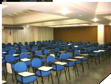
Salão de Convenções

Projeto Cairu na Comunidade – visa atender a comunidade através da participação de alunos nos programas: Imposto de Renda Gratuito - consultoria e envio da Declaração de Imposto de Renda gratuitamente; Cairu é nota 10 em Solidariedade - incentivo ao voluntariado, seminário sobre Responsabilidade Social; Estudante Solidário - campanhas de doação de sangue, seminários e palestras sobre Ética; Convênios com instituições de auxílio à criança e ao adolescente, campanhas de arrecadação de presentes e alimentos e Formação Continuada.