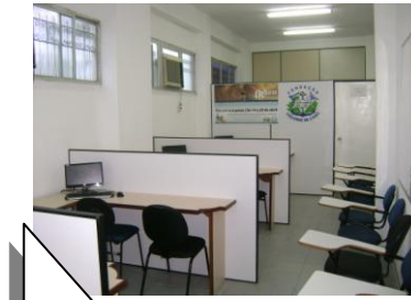
Núcleo de Práticas Contábeis

Núcleo de Práticas Contábeis – criado com o objetivo de estimular práticas de contabilidade.