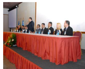
← Ciências Contábeis Congresso de Contabilidade Hotel Fiesta Salvador-Ba

No cenário atual, com a globalização e a formação de blocos econômicos, o papel do Administrador habilitado em Comércio Exterior ganha cada vez mais importância. As novas políticas que colocam em prática a viabilização do crescimento desse intercâmbio comercial potencializam a área no Brasil. Nesse cenário, a Bahia tem feito grandes investimentos consolidando-se no setor e ampliando mercados. A Cairu forma gestores internacionais aptos a gerir pequenas, médias ou grandes empresas, dominando as ferramentas necessárias para: tomar decisão, desenvolver estratégias que viabilizem novas oportunidades de negócios e articular profissionais, matérias-primas e demais insumos com o objetivo de oferecer produtos e serviços com qualidade competitiva nos mercados interno e externo.