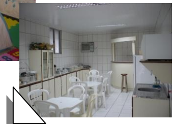
Laboratório de A&B

Laboratório de A&B - agrega exercício prático da disciplina Alimentos e Bebidas, no curso de Turismo, orientando e refletindo as práticas da área.