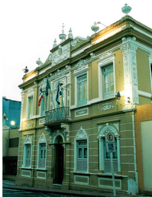
Fachada do prédio “Casa Guilherme Marback” Tombada pelo IPAC em 2003