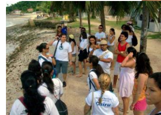
← Turismo Saída Técnica Ilha de Maré- SSA