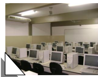
Laboratório de Informática

Laboratórios de Informática – são 08 (oito) laboratórios equipados com modernos equipamentos de informática e acesso à internet, capacidade total para 380 alunos, além do sistema Wireless - rede sem fio.